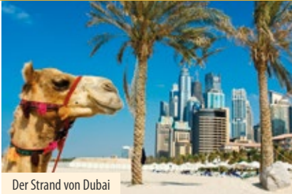
Der Strand von Dubai