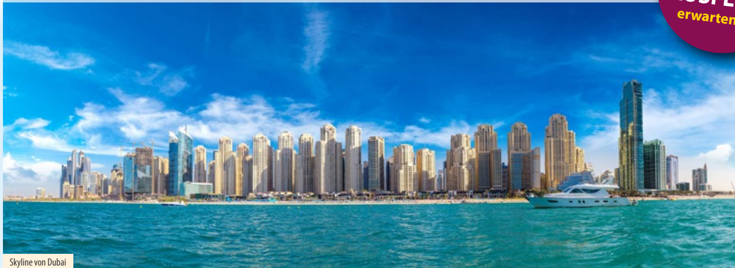
Skyline von Dubai

Faszinierende, unvergessliche AUSFLÜGE erwarten Sie!