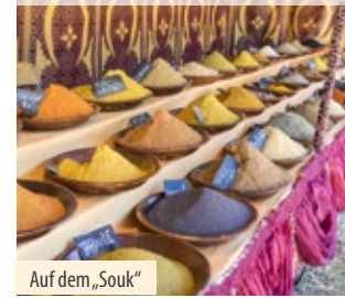
Auf dem „Souk“