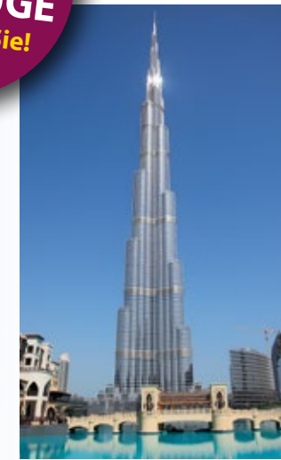
Das höchste Bauwerk der Welt: Burj Khalifa